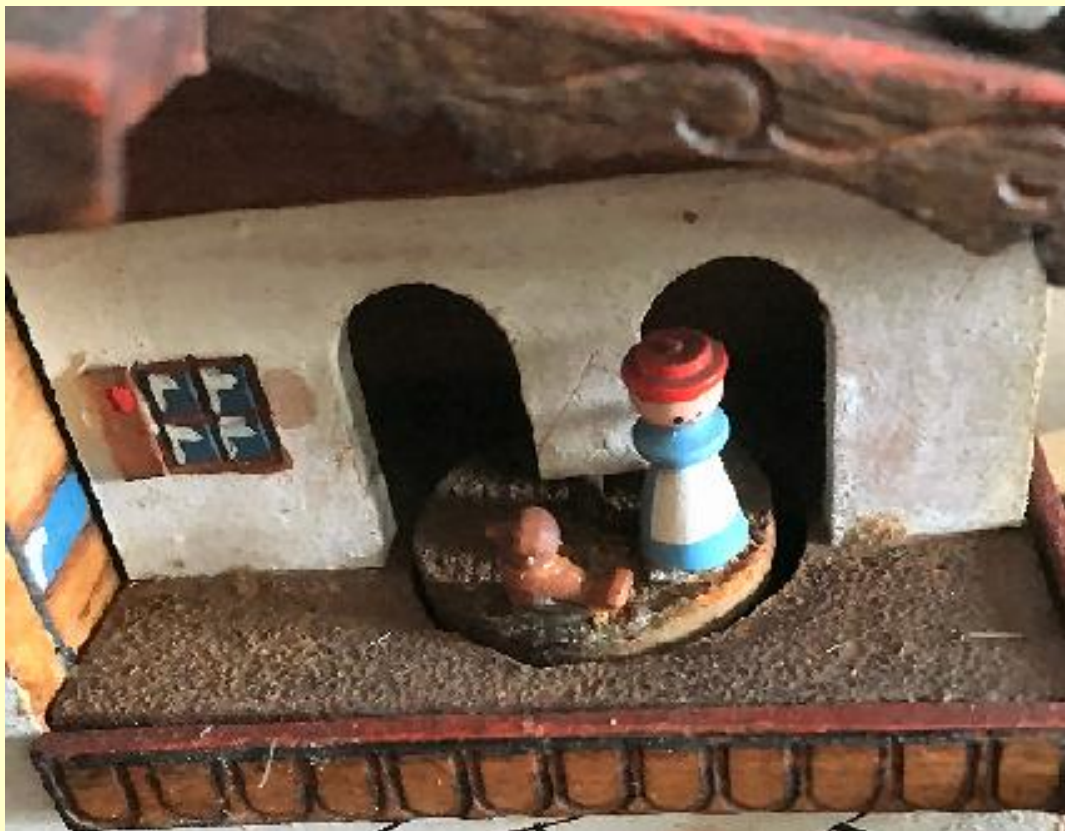
Particolare piatto rotante