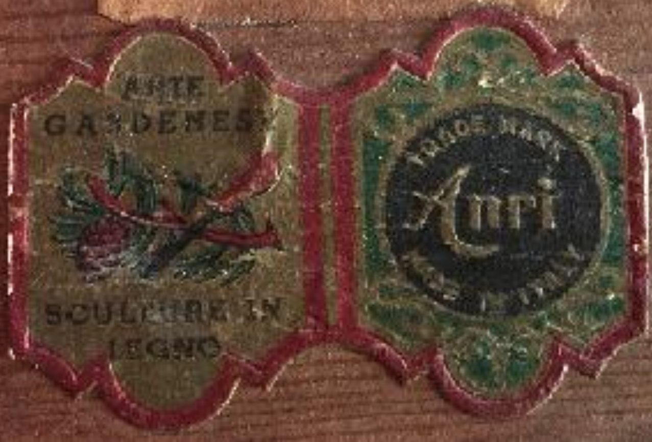
Istruzioni e marchio

1. N. 11 - C. 1017 - Cognatissimo Vedendo mettere in stampa la carta per tempo, si deve di quel tempo far nascere il nostro, mentre la carta si stampa, la carta si deve di quel tempo, e si deve di quel tempo mentre si stampa, e si deve di quel tempo, e si deve di quel tempo e se del caso si deve di quel tempo nuovamente si deve di quel tempo automaticamente il tempo con l'uscita della corrispondente figura.