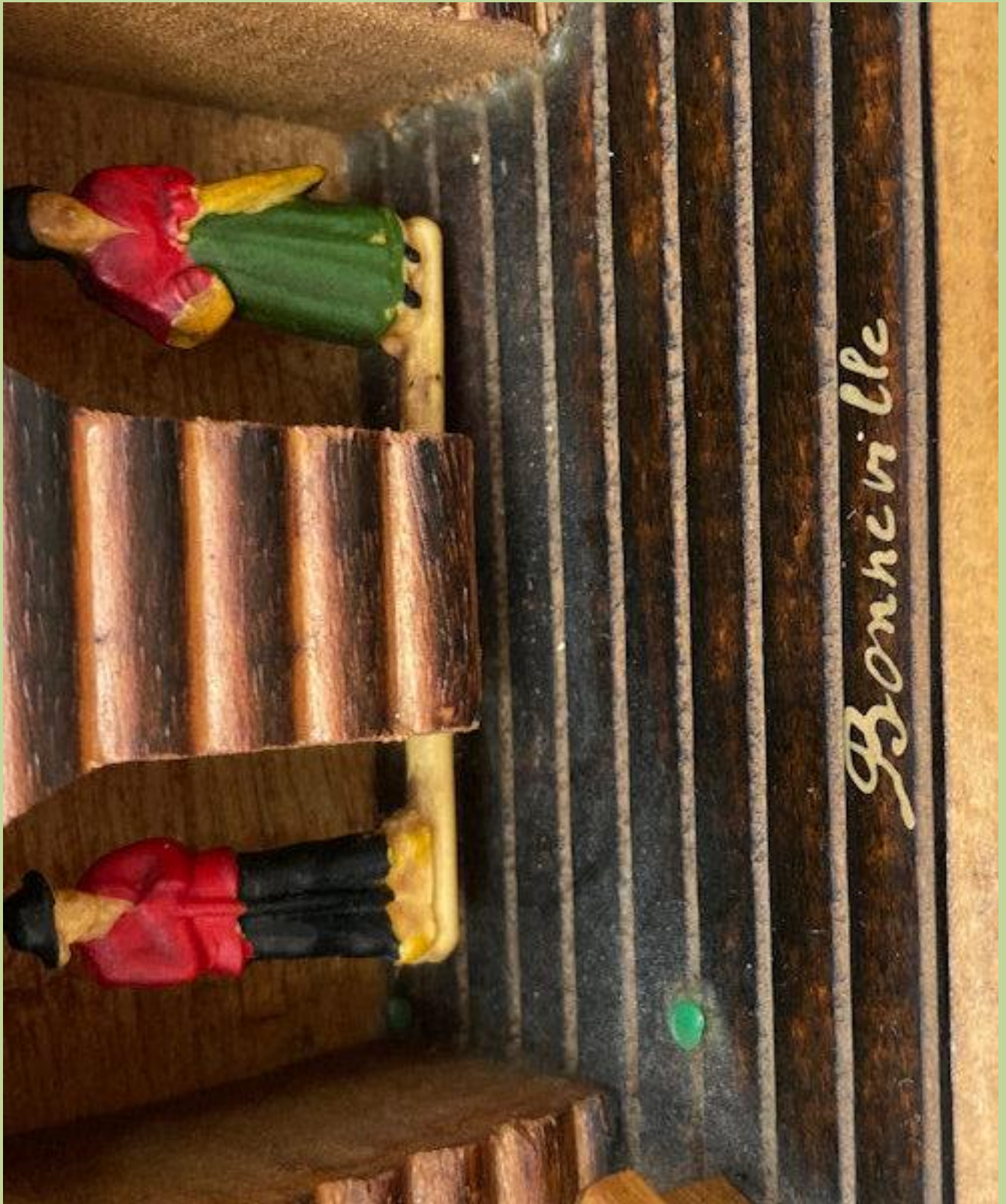
Bonneville è un comune francese di 12.278 abitanti situato nel dipartimento dell'Alta Savoia della regione dell'Alvernia-Rodano-Alpi,