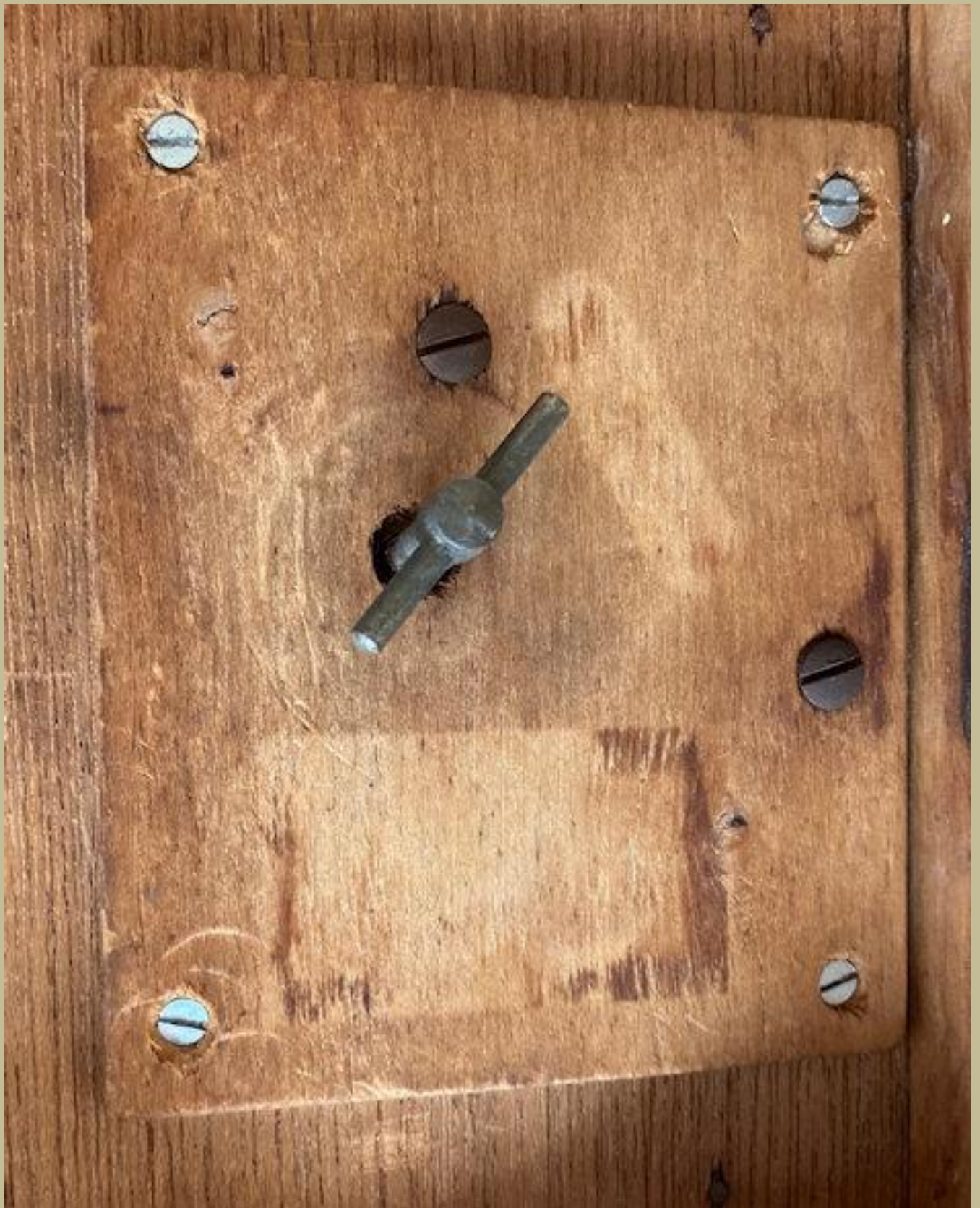
La chiave di carica del carillon.