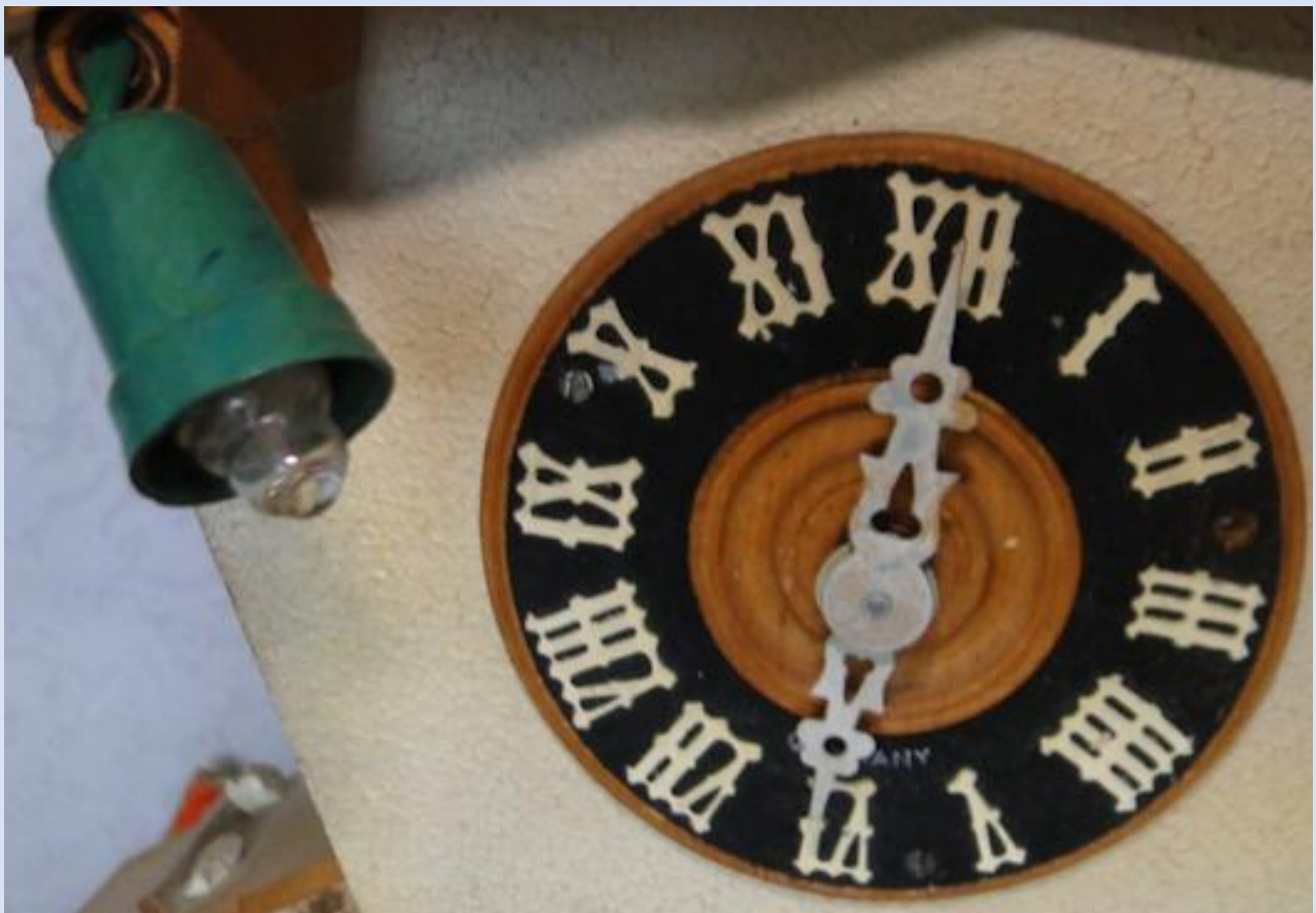
L'orologio e la lucetta