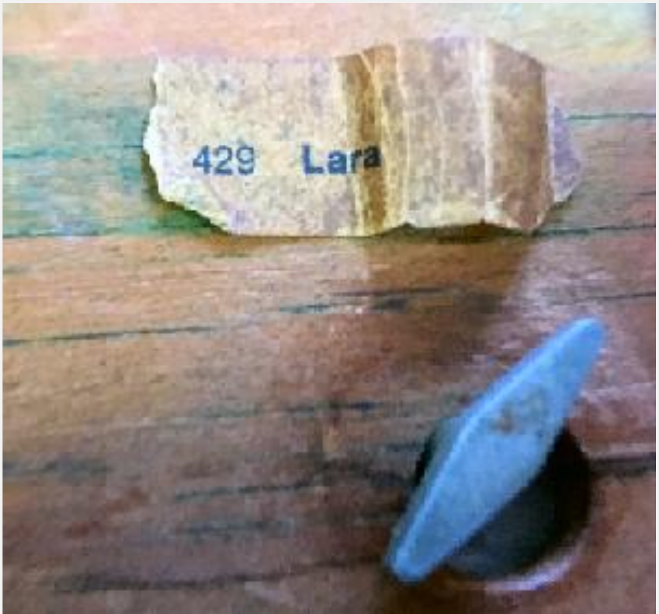
Manovella e il tema del carillon (429 Lara)