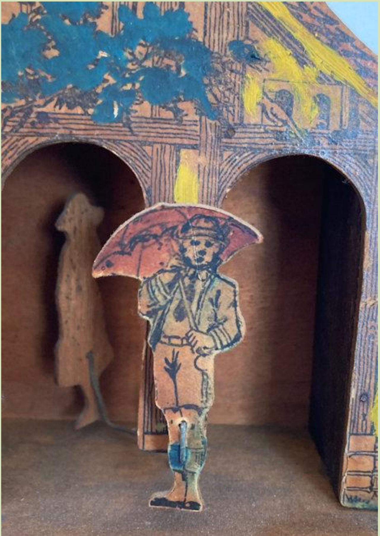
Uomo= brutto tempo