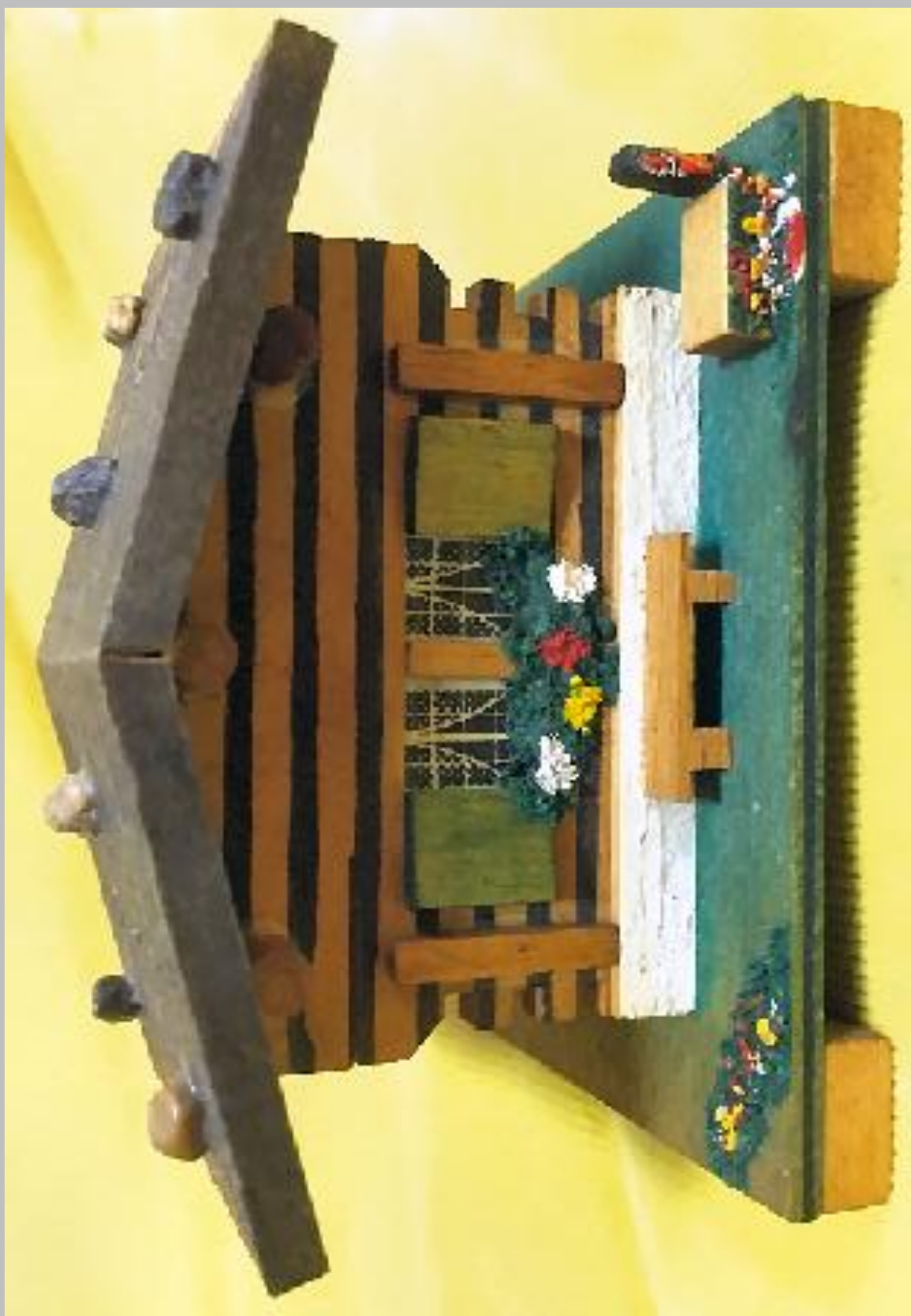
ao-17: Piccola casetta portagioie. Dimensioni: cm.6,5x8x6