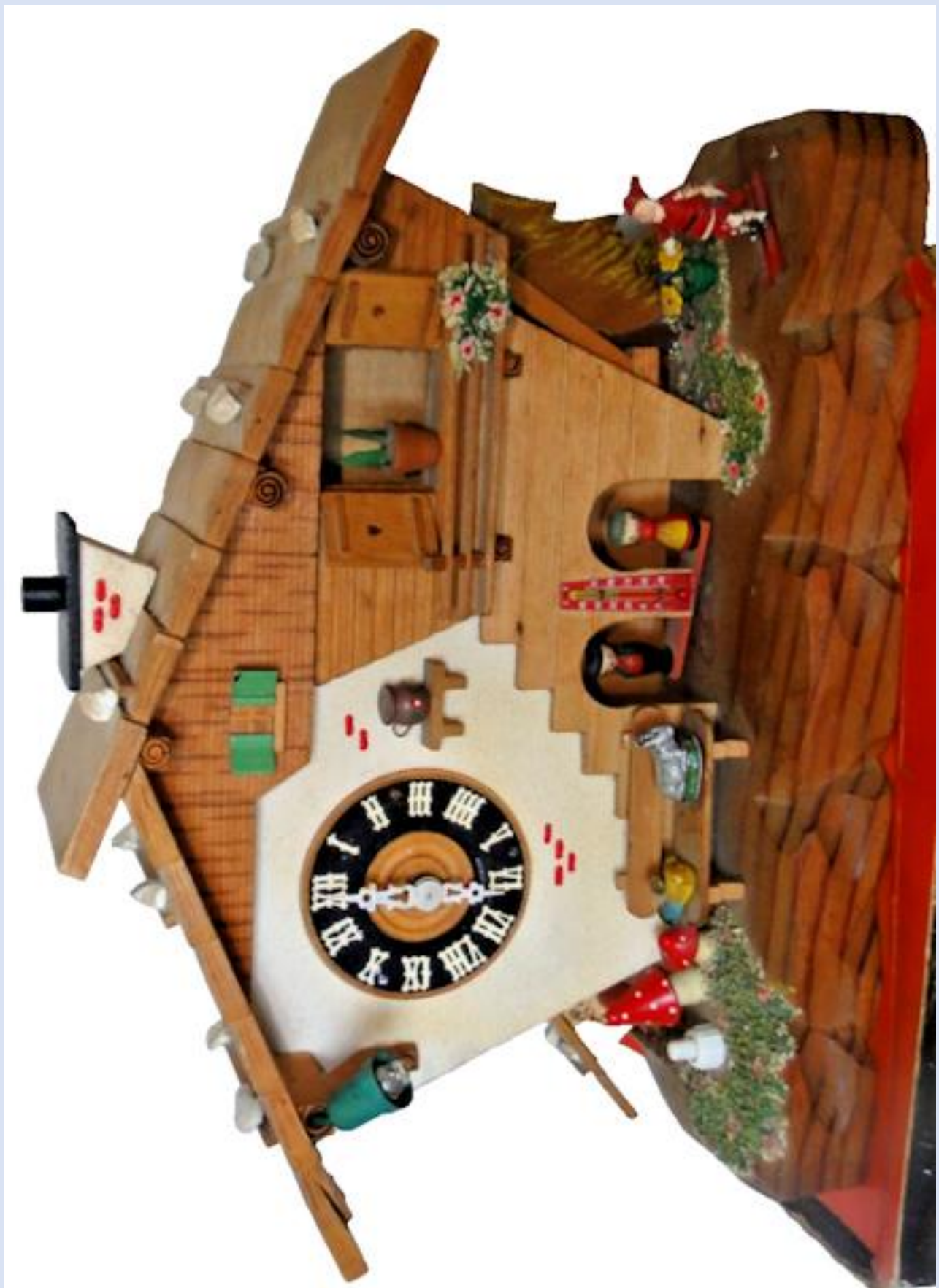
ao-37: Casetta meteo con orologio meccanico Dimensioni: cm.22x34x9