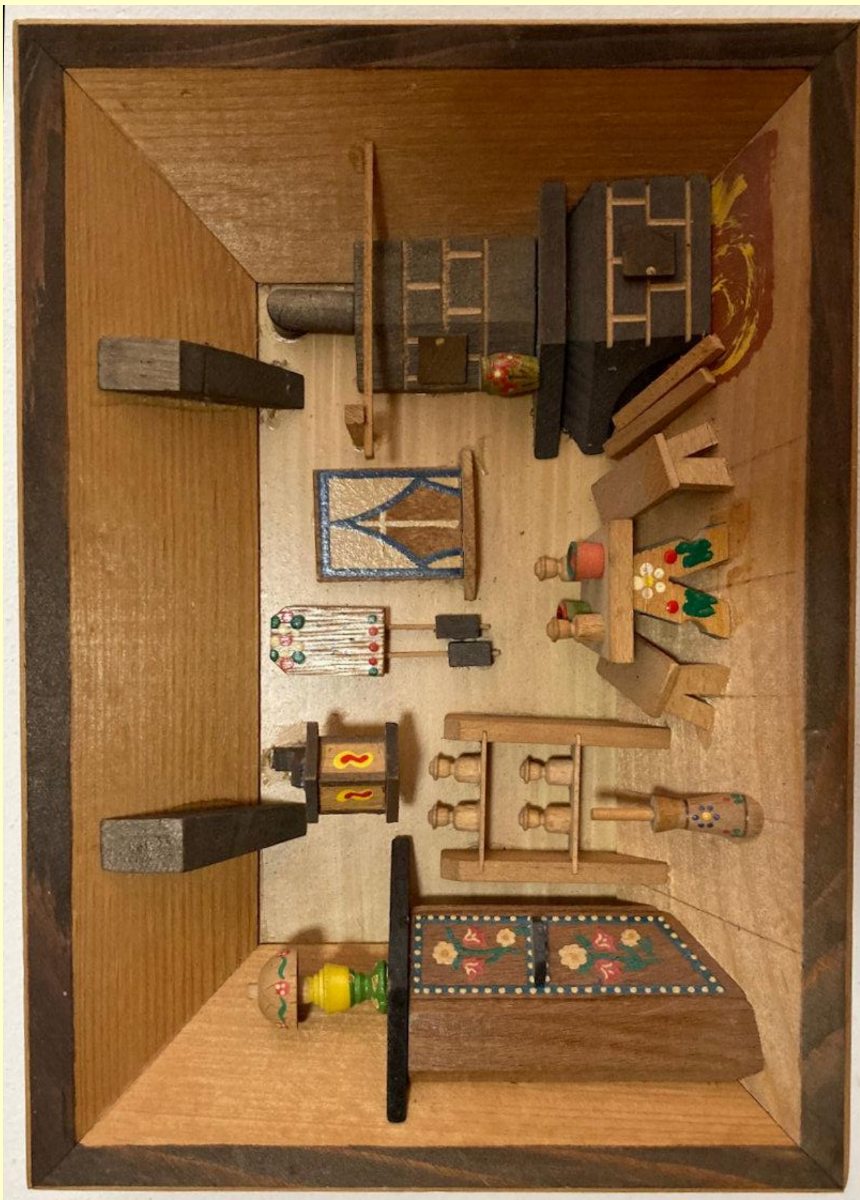
ao-24: Quadretto con diorama stube. Dimensioni: cm.19x27x4