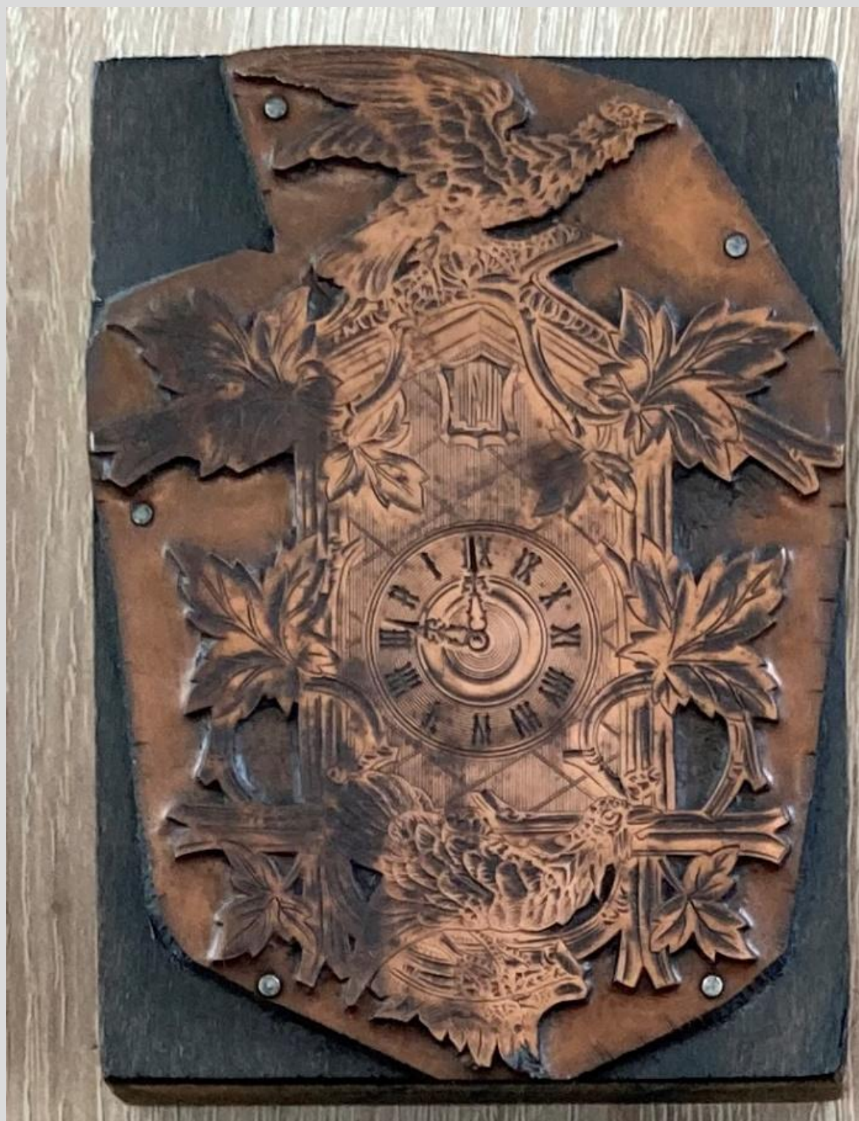
ao-29: Matrice per stampa pubblicitaria dei cucù Hubert Herr. Dimensioni: cm.10x7,5x2