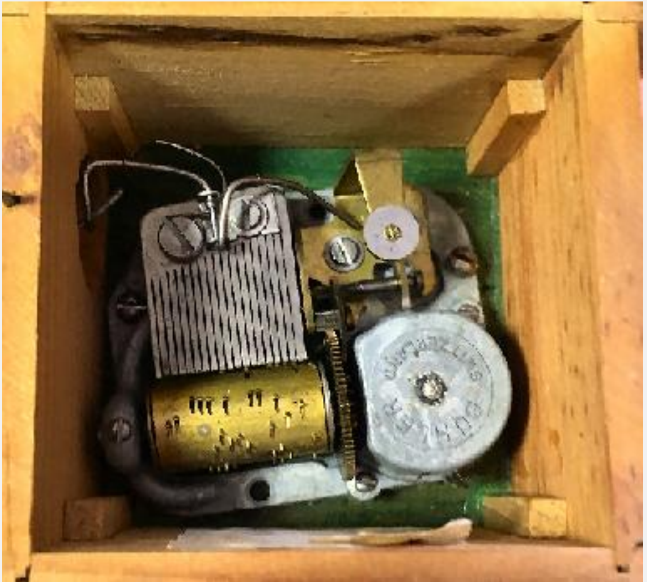
Particolare del carillon