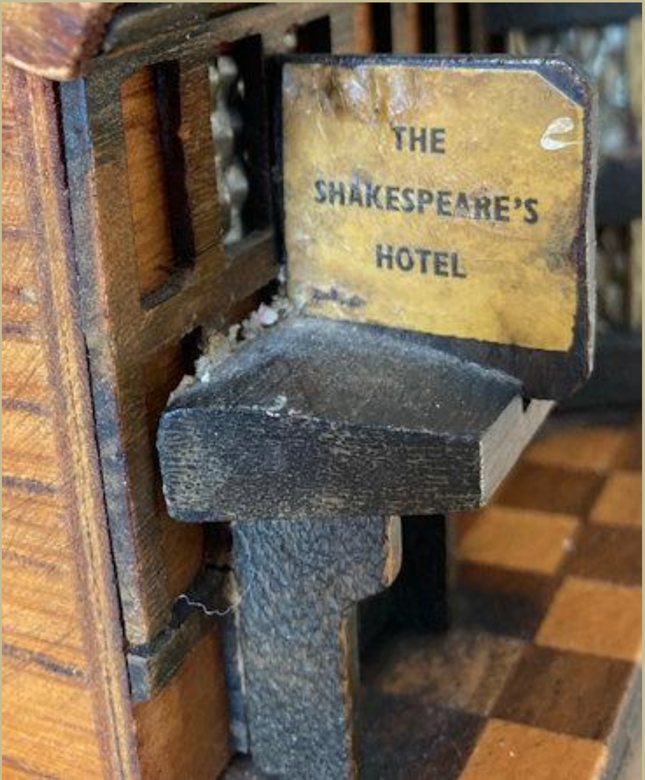
La targa del The Shakespeare Hotel