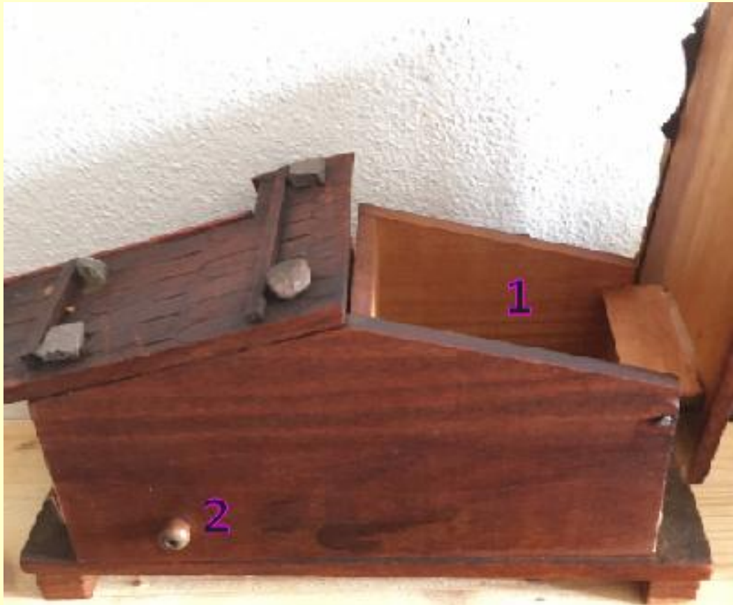
1= Scomparto per gli oggetti. 2= Pomello dell'asta che libera il carillon