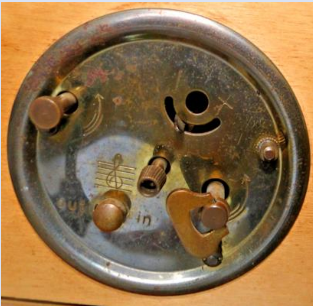
Particolare della carica