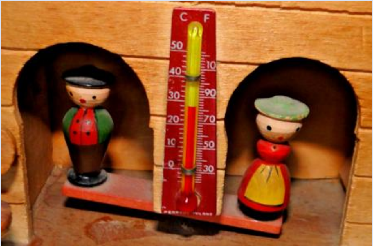
Parte metereologica con termometro a gradi Cerlius e Reamur.